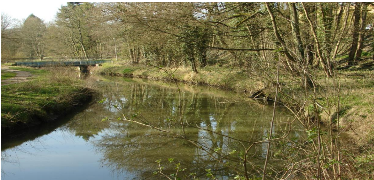
L'Yvette dans l'université de Bures -Orsay

La rivière Yvette est un cours d'eau non domanial, affluent de l'Orge et sous-affluent de la Seine qui coule dans la vallée de Chevreuse à travers les départements des Yvelines et de l'Essonne , dans la région Île-de-France.