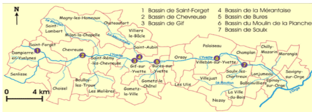
Le réseau hydrographique de l'Yvette en Essonne

Depuis sa création, le SIAHVY a aménagé 10 bassins de retenue dont sept sur l'Yvette : Saint Forget, Chevreuse, Gif sur Yvette, Gif/Bures sur Yvette, Villebon sur Yvette et Saulx les Chartreux un sur la Mérantaise, un sur le Vaularon à Gometz le Châtel et un sur la Frileuse affluent du Vaularon. Trois structures réservoir complètent ce dispositif, représentant un volume utile de 1 831 000 m 3 , dispersés sur son territoire.